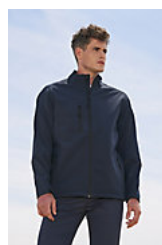
SOL'S RELAX 46600